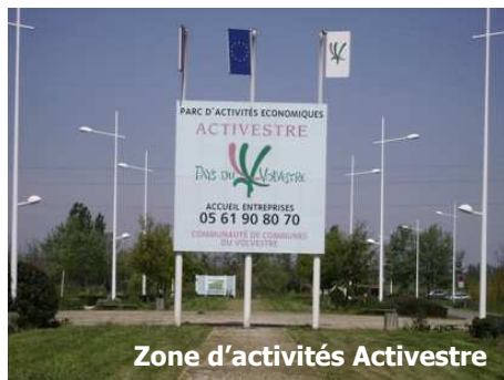
Zone d'activités Activestre

Enfin, le secteur du commerce est sous-représenté mais connaît une progression constante ces dernières années.