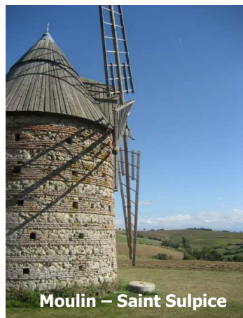
Moulin – Saint Sulpice

Ainsi, le STIE sera prochainement réactualisé, en veillant à son articulation avec le SCoT (exemple : prise en compte des projets économiques identifiés dans le SCoT).