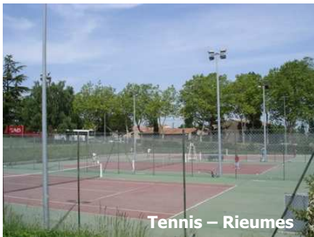
Tennis – Rieumes

Néanmoins, les documents de planification communale sont de plus en plus nombreux et il y aurait selon le diagnostic, un potentiel de locaux disponibles pour l'habitat.