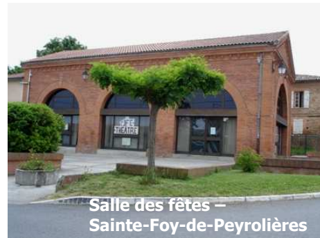
Salle des fêtes – Sainte-Foy-de-Peyrolières