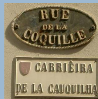
D'autres rues occitanes