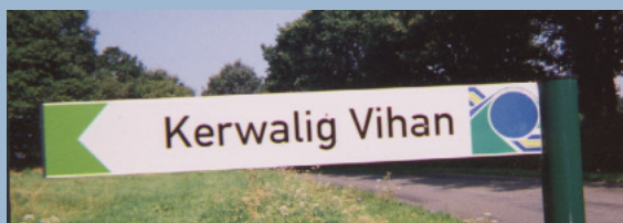
L'avant et l'après : un exemple de correction toponymique en Bretagne

D'AUTRES ACTIONS SONT POSSIBLES POUR RENDRE L'OCCITAN PRÉSENT DANS UNE COMMUNE. ELLES SONT PRÉSENTÉES DANS UN DOCUMENT RÉALISÉ PAR LE COMITÉ ANEM ÔC.