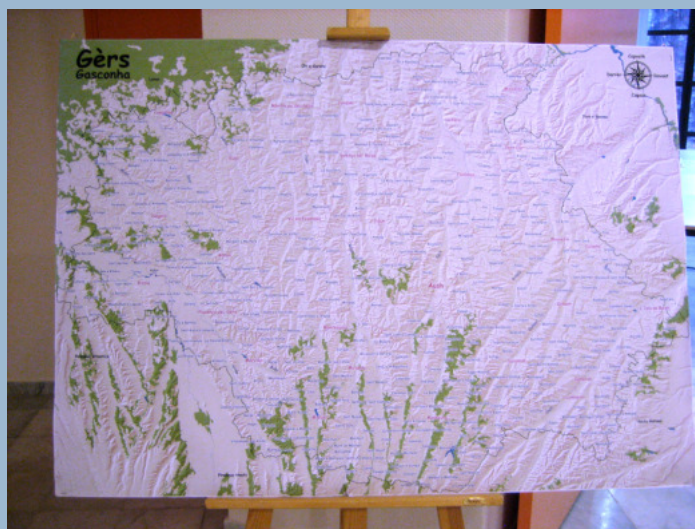
Plusieurs cartes et ouvrages toponymiques ont déjà été réalisés comme ci-contre la carte du Gers, éditée par le Conseil Général du Gers.

Yves Lavalade, L'exemple du Limousin, Congrès Toponymie et signalisation bilingue, Auch, 2007.