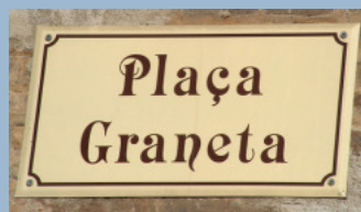
Les rues de Gap