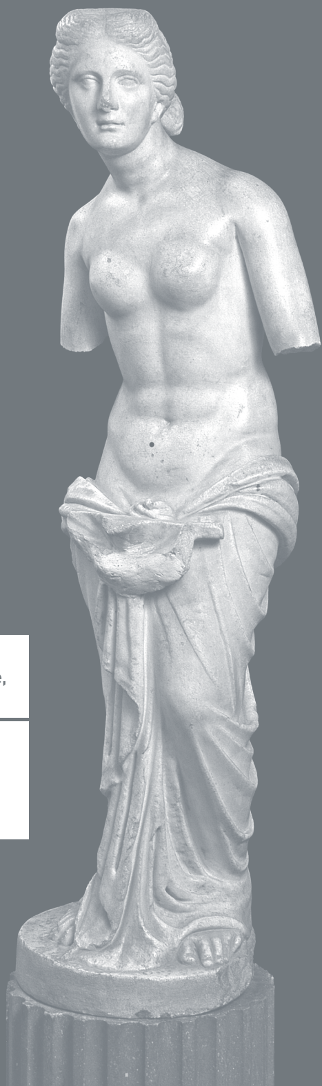
Aphrodite à la coquille dite Nympe de Sainte-Colombe, marbre, IIe-IIIe siècle.

Œuvre d'intérêt patrimonial majeur acquise pour le musée gallo-romain de Saint-Romain-en-Gal (Vienne), grâce au mécénat de la Banque Neuflize OBC.